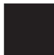
LACA NEGRA BLACK LACQUER LAQUE NOIR