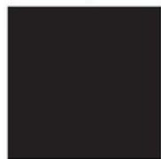
NEGRO BLACK NOIR