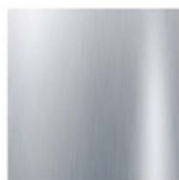
CROMO CHROME CHROME

IS ISMOBEL Polígono La I C/ Cordonera T. +34 941 2 E-26006 LOJ (LA RIOJA) - I ismobel@sm ismobel.