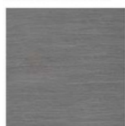
CENIZA ASH CENDRÉ