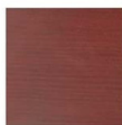
CEREZO CHERRY CERISIER