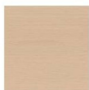
ROBLE OAK CHÈNE