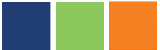
AZUL BLUE / BLEU VERDE PISTACHO GREEN PISTACHO / VERT PISTACHE NARANJA ORANGE / ORANGE