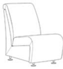
SEVILLA 1 SIN BRAZOS