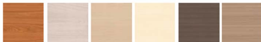
CEREZO CHERRY / MÉRISIE HAYA BEECH / HÊTRE ROBLE OAK / POIRIER ARCE MAPLE / ERABLE TEKA TEAK / TECK BACO BACO / BACO