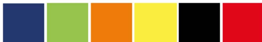
AZUL BLUE / BLEU VERDE PISTACHO GREEN PISTACHO VERT PISTACHE NARANJA ORANGE / ORANGE AMARILLO YELLOW / JAUNE NEGRO BLACK / NOIR ROJO RED / ROUGE

ELEMENTOS VERTICALES VERTICAL ELEMENTS ÉLÉMENTS VERTICAUX