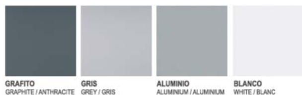
GRAFITO GRAPHITE / ANTHRACITE GRIS GREY / GRIS ALUMINIO ALUMINIUM / ALUMINIUM BLANCO WHITE / BLANC